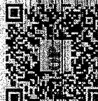
Aponte a câmera do celular e acesse mais notas exclusivas de Niella Fekelerle

O Congresso de Laboratórios da Associação dos Laboratórios de Análises Clínicas e Patológicas (Congralap 2024) tem início hoje no Centro de Eventos. Aproximadamente 800 profissionais devem participar do congresso, que pretende promover o intercâmbio de conhecimentos, além do lançamento de novos equipamentos para o setor.