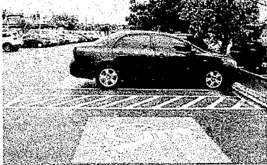
FAIXA BRANCA pintada ao lado das vagas de carros para PCDs