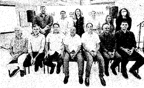
PREFEITOS DE 11 municípios assinaram o termo de adesão ao programa Ceará por Elas

A capacitação de profissionais dos municípios também é prevista no programa. "Ter alguém no equipamento municipal que saiba orientar, que saiba dizer para onde ele vai, o que ele pode fazer, que este capacidade para abrir o sistema e solicitar, por exemplo, uma medida protetiva de urgência, que faça esse encaminhamento é fundamental", afirma a secretária.