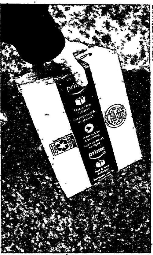
A AMAZON afirmou estar satisfeita com o Reme Conforme