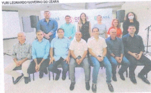
PREFEITOS DE 11 municípios assinaram o termo de adesão ao programa Ceará por Elas

A capacitação de profissionais dos municípios também é prevista no programa. "Ter alguém no equipamento municipal que saiba orientar, que saiba dizer para onde ela vai, o que ela pode fazer, que esteja capacitada para abrir o sistema e solicitar, por exemplo, uma medida protetiva de urgência, que faça esse encaminhamento é fundamental", afirma a secretária.