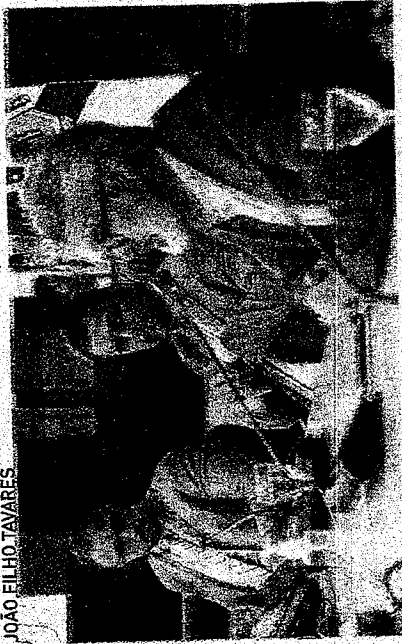
SEGUNDA edição do programa Político, Eul?! foi lançada ontem na CMFFor

WWW.OPORVO.COM.BR QUARTA FEIRA FORTALEZA - CEARÁ - 28 DE FEVEREIRO DE 2024