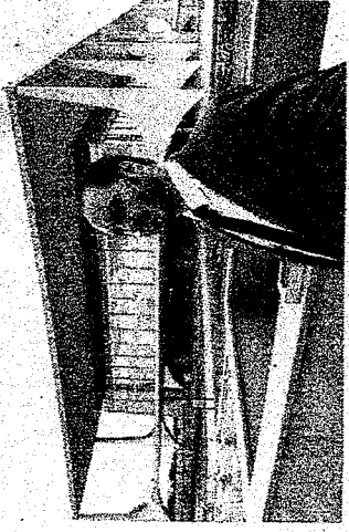
CARLOS Bolsonaro é alvo da PF em operação sobre uso irregular da Abin