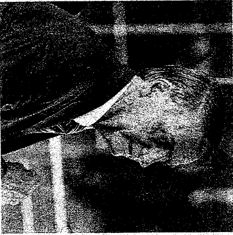
BOLSONARO manobrou para tentar liberar joias apreendidas