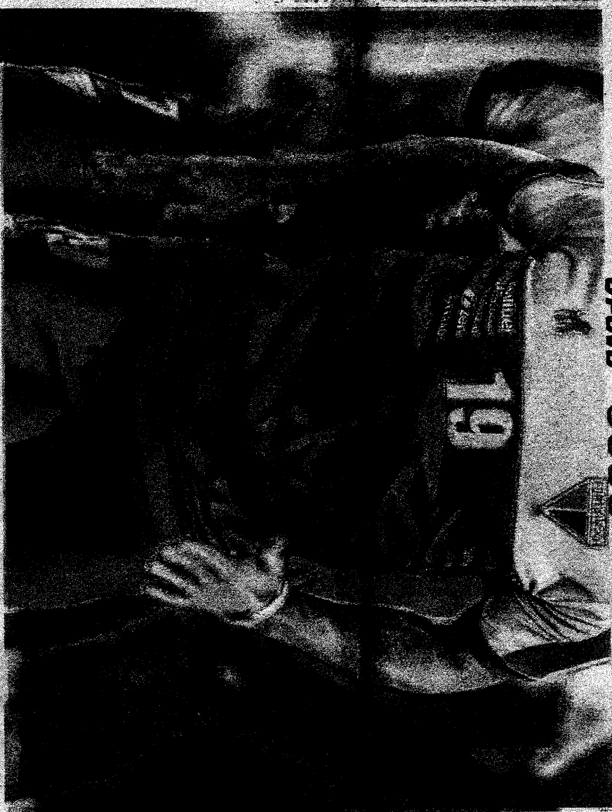
Brizex é um dos pilares da defesa do Fortaleza

JOÃO PEDRO OLIVEIRA ESPECIAL PARA O POVO joao.pedro@opovo.com.br