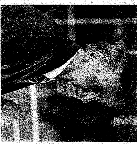
BOLSONARO manobrou para tentar liberar jóias apreendidas