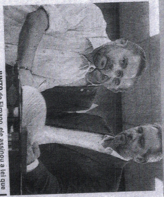
JUNTO de Elmano, ele assinou a lei que fixa um piso para advocacia na OAB-CE

O governador Elmano retomou essa secretaria, alinhado com a política nacional”, disse. “Nosso papel será coordenar, organizar e dar um sentido de integração em diversas ações