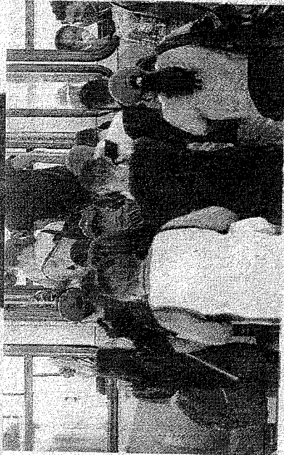
É COMUM aglomeração nos terminais de ônibus de Fortaleza no horário de pico