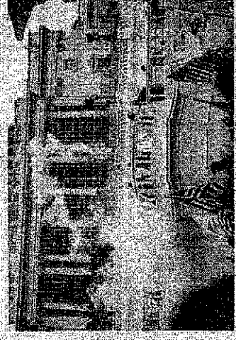
INVASÃO aconteceu após uma reunião com o então presidente Trump