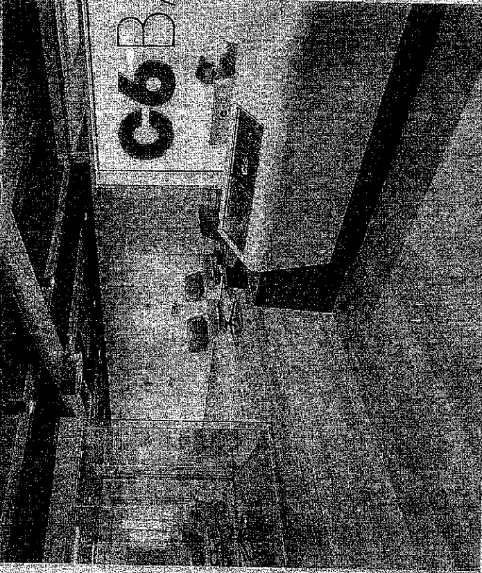
C6 Bank foi uma das fintechs a liderar investimentos no Brasil

ram os fundos de venture capital, que investem em startups, a bater um novo recorde anual de aportes no Brasil. Esses fundos aportaram R$ 66,5 bilhões no ano passado em startups brasileiras, triplicando a cifra registrada um ano antes, segundo pesquisa da KPMG e da Associação Brasileira de Private Equity e Venture Capital (Abveap). Foi o quarto ano consecutivo de recorde.