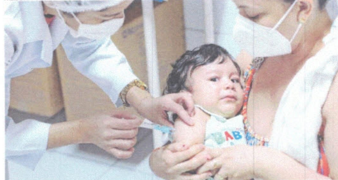
A VACINAÇÃO contra gripe e outras doenças é colocada como fundamental para diminuir a circulação viral