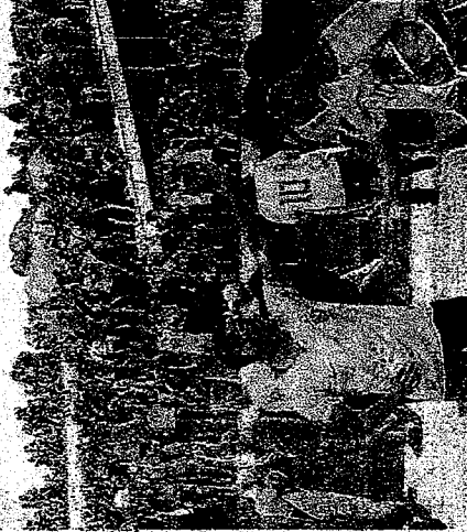
APOIADORES DE Bolsonaro invadiram as sedes dos Três Poderes em Brasília

GLO são as iniciais das operações de Garantia da Lei e da Ordem, nas quais o governo mobiliza efetivos militares para preservar a tranquilidade pública. A sugestão, vinda de Mourão, ou de qualquer outra pessoa, é mais um motivo de inquietação. Por que o presidente deveria baixar um decreto de Garantia da Lei e da Ordem, se o palácio estava invadido? O Batalhão da Guarda Presidencial não precisa de decreto para guardar o palácio presidencial.